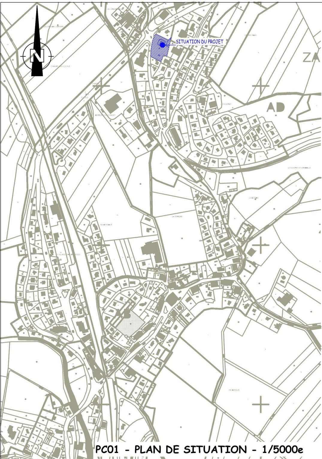
PC01 - PLAN DE SITUATION - 1/5000e