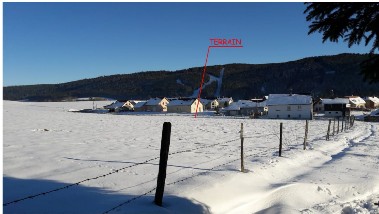
PC08b - VUE DE LOIN