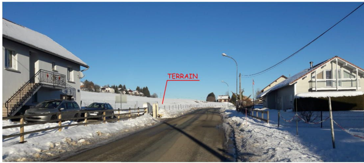
PC07 - VUE DE PRES