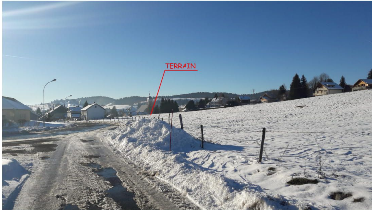
PC08a - VUE DE LOIN